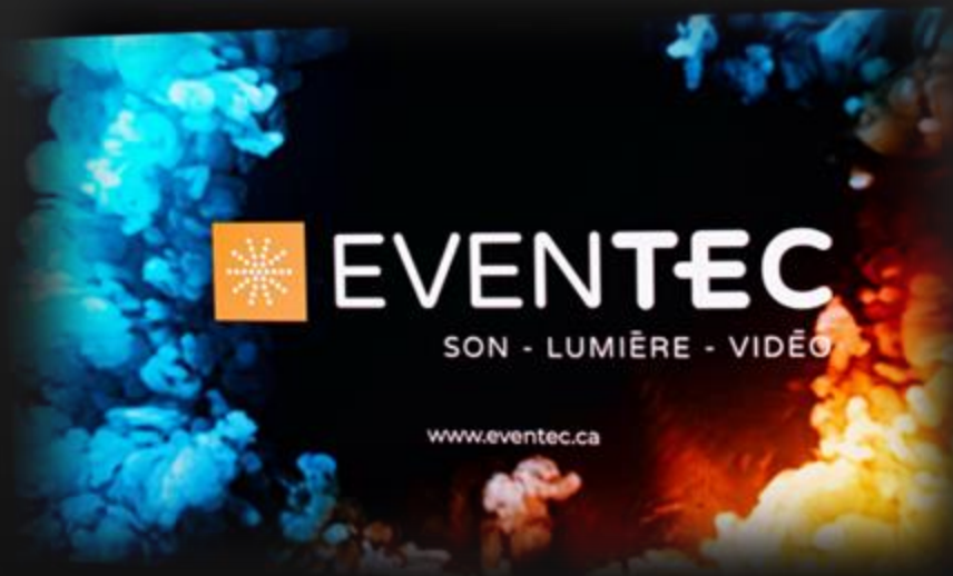
H 6' x L 12', soit 6 totems de largeur