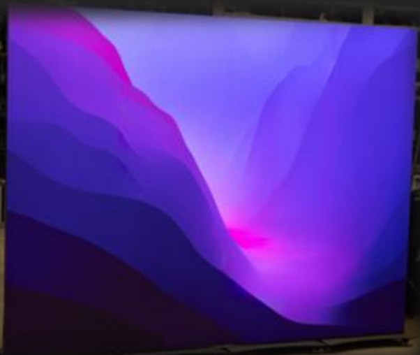
H 6' x L 8', soit 4 totems de largeur