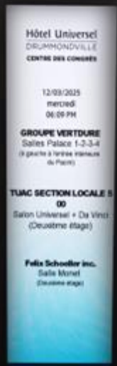
H 6' x L 2'